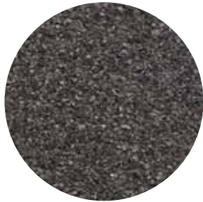
Fine mineral black