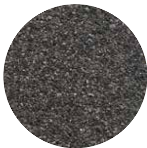
Fine mineral black